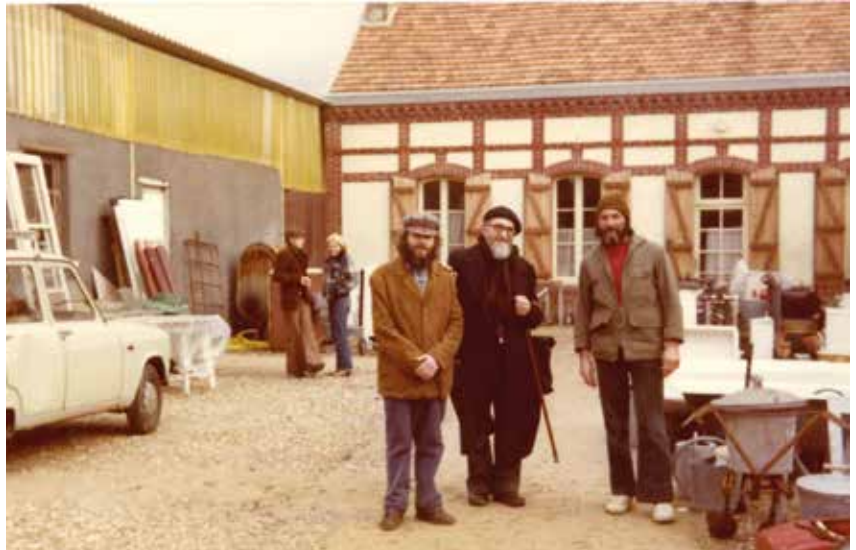
Visite de l'Abbé Pierre à Emmaüs Liberté, installé rue des Hauts-Buissons à Dreux dès 1976.

Les débuts d'Emmaüs aux Hauts-Buissons démarrent en 1976. Le 8 mars de cette année-là, trois compagnons arrivent à Dreux, dans le quartier Prod'hommes, où la municipalité de l'époque leur loue