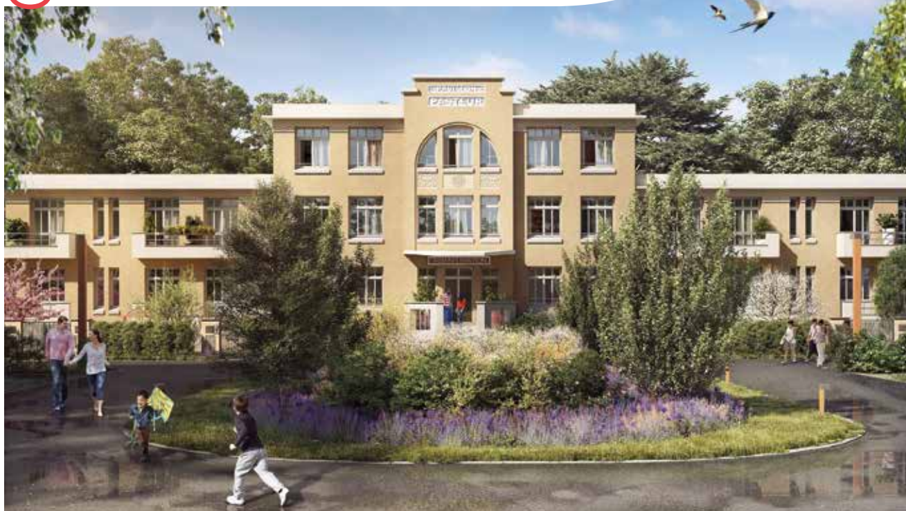
Perspective extérieure non-contractuelle