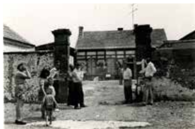
Entrée principale d'Emmaüs Liberté à Dreux.

Plongée dans les archives. Une planche contact d'une cinquantaine de photos ont été retrouvées et reproduites. Elles sont issues des archives de l'Abbé Pierre et d'Emmaüs International déposées aux Archives nationales du monde du travail à Roubaix (France).