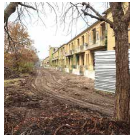
En mai 2024, les bâtiments du sanatorium dont le pavillon Pasteur seront prêts pour la phase restauration du bâti.

Il fait partie des rares sanatoriums en France à avoir été construits à l'horizontal. Une originalité à laquelle s'ajoute une typologie architecturale d'exception, dont son caractère "Art Déco". Ces qualités lui ont valu d'être classé en 2022 au titre des Monuments historiques, en plus de sa labellisation "Architecture contemporaine remarquable" obtenue en 2014. Des niveaux de protection qui garantissent la préservation du site à la fois sur les parties bâties (façades, toitures) et non bâties (jardins). Les opérateurs du projet [R] sont ainsi soumis à des contrôles de la Direction régionale des affaires culturelles (Drac).