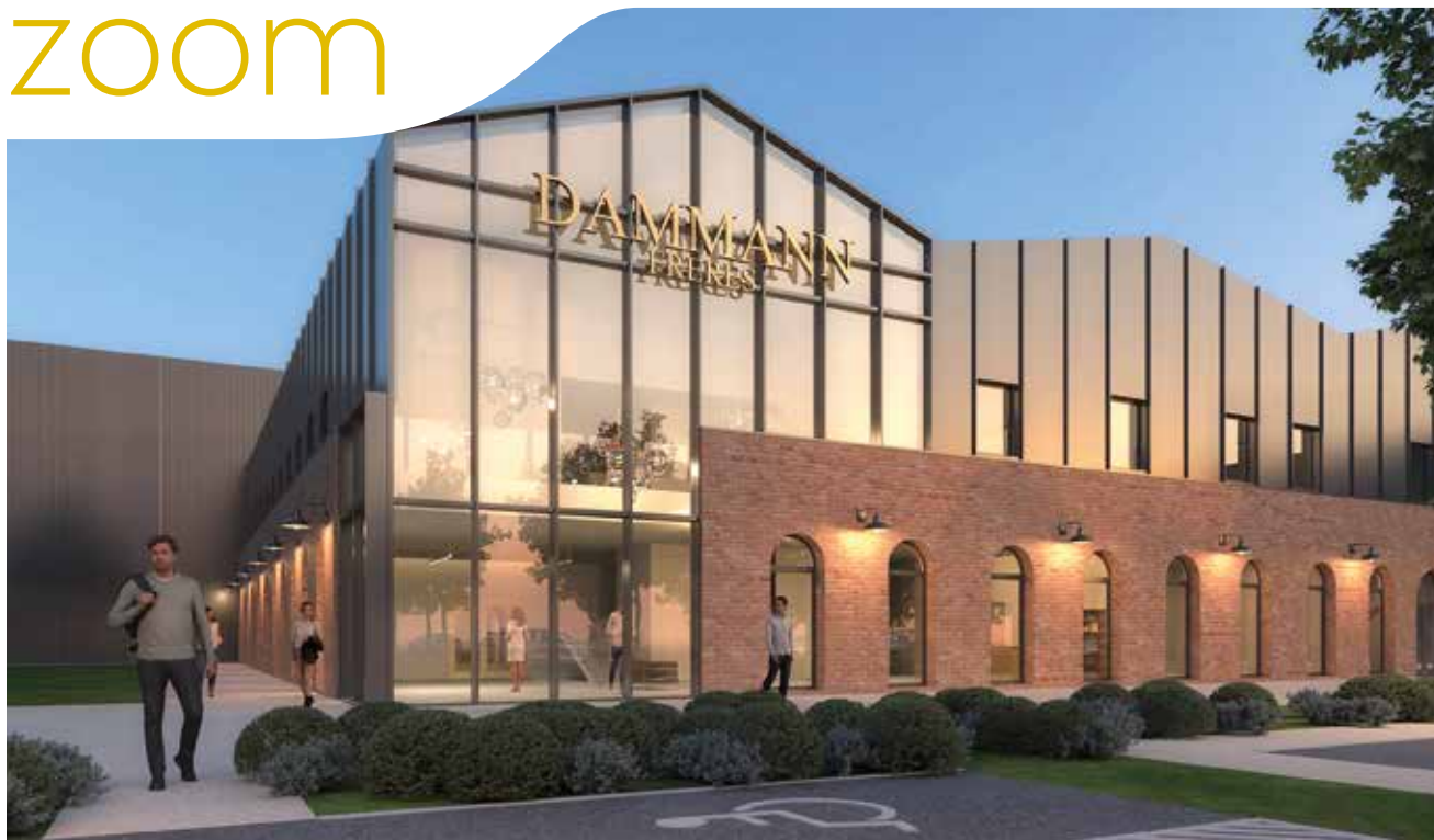
Projection du futur site Dammann © MCA Architecte