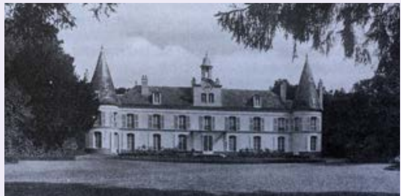
Photographie du château de Comteville au début du XX ème siècle.

Acheté par la Ville de Dreux en 1980, le domaine de Comteville servit quelque temps comme centre de loisirs et abrita pendant une vingtaine d'années les voitures anciennes du Rétro mobile club Drouais.