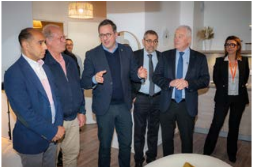
Le maire, Pierre-Frédéric Billet, a inauguré en mai les appartements témoins de la résidence Élixir avec de nombreux élus.

En complément, Domytis propose aussi de nombreux services dont une sécurité 24h/24, une assistance administrative, des aides ménagères, ainsi qu'un accompagnement personnalisé pour répondre aux besoins notamment médicaux des occupants (visites à domicile, prises de rendez-vous, etc.).