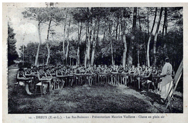
12. - DREUX (E.-et-L.). - Les Bas-Buissons - Préventorium Maurice Viollette - Classe en plein air

Construction de l'ancien sanatorium sous l'impulsion de Maurice Viollette, maire de Dreux de 1908 à 1959