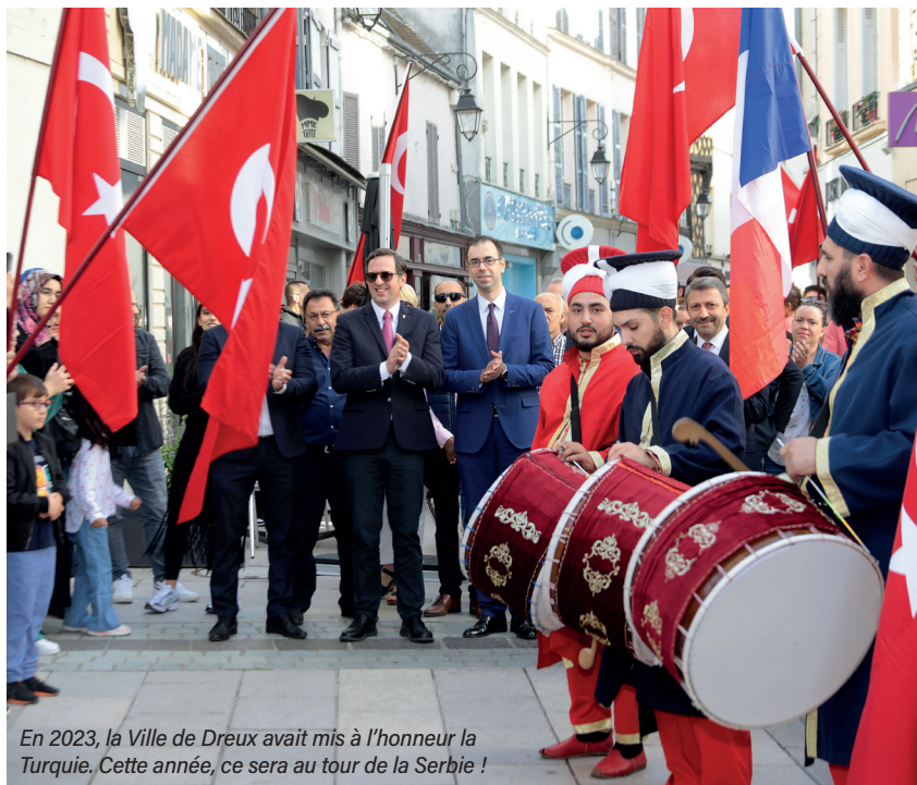
En 2023, la Ville de Dreux avait mis à l'honneur la Turquie. Cette année, ce sera au tour de la Serbie !

La traditionnelle foire Saint-Denis revient dans la cité durocasse les 5 et 6 octobre prochains pour sa 845 ème édition ! Cette année, retrouvez un village gourmand et artisanal, des commerçants non sédentaires, une place des saveurs avec food trucks , des restaurateurs et associations. Professionnels ou associations, rejoignez dès à présent cet événement incontournable pour y faire découvrir votre savoir-faire. Pour cela, contactez la Maison de l'Habitat et du Commerce (8/10 ; rue du Général de Gaulle) au 02.37.38.55.00 pour obtenir plus d'informations ainsi que le formulaire d'inscription. À noter : les inscriptions pour le vide-greniers des particuliers ouvriront début septembre à la Maison Proximum Centre-ville.