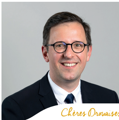
© A. Lombard-Agollo du Pays de Dreux.