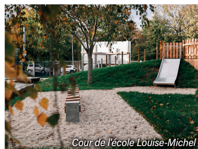
Cour de l'école Louise-Michel

Du côté de la végétalisation par exemple, Dreux a réalisé des actions phares telles que la première " Cour oasis" - entièrement végétalisée et déminéralisée - inaugurée en novembre 2023 à l'école Louise-Michel aux Oriels. La végétalisation de la place Rotrou ou encore l'engazonnement des cimetières comptent aussi parmi des actions vertes. Les grands projets font également la part belle à la végétalisation à l'instar de la future école des Bâtes, la réhabilitation du sanatorium ou encore l'éco-quartier de la ZAC du Square. En plein cœur de cet éco-quartier, un grand parc de 1 hectare verra le jour courant 2025. Une autre manière de faire entrer la nature en ville.