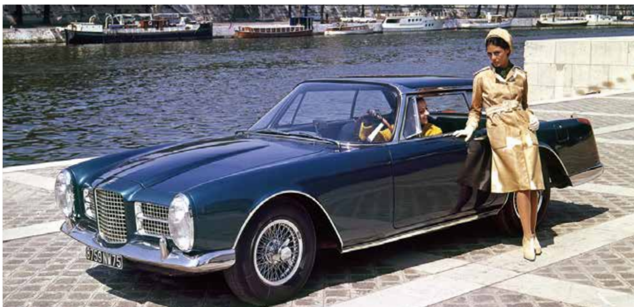
Quais de Seine

Fleuron de l'industrie drouaise, Facel Vega fête cette année les 70 ans de sa création. L'occasion de mettre en valeur l'histoire de cette entreprise automobile lors des Journées européennes du patrimoine (JEP). Au programme : inaugurations, exposition et tours de pistes pour tous !