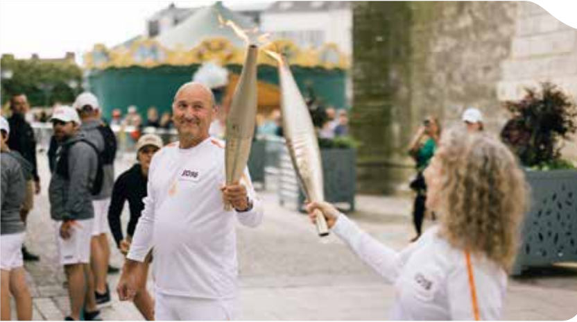
Flamme olympique Ⓣ

Cet été, Dreux a résonné plus fort que jamais, marquant une saison exceptionnelle en événements et émotions. Le coup d'envoi a été donné par un moment historique : le passage de la Flamme olympique qui a illuminé la ville et lancé en grande pompe les festivités estivales. Parmi les moments forts, on retrouve les célébrations du 14 juillet, les concerts de l'Été sous les charmes ou encore les Estivales à Comteville. La Ville a aussi commémoré les 80 ans de sa Libération lors d'une journée mémorielle émouvante, où toutes les générations se sont réunies pour célébrer l'Histoire et ses héros.