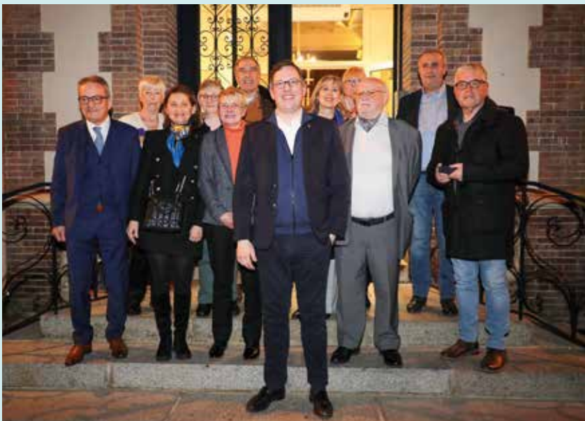
Dix commerçants de Dreux ont reçu la médaille de la Ville, lundi 24 mars.

Autre institution drouaise : l'armurerie Laudier en Grande-Rue