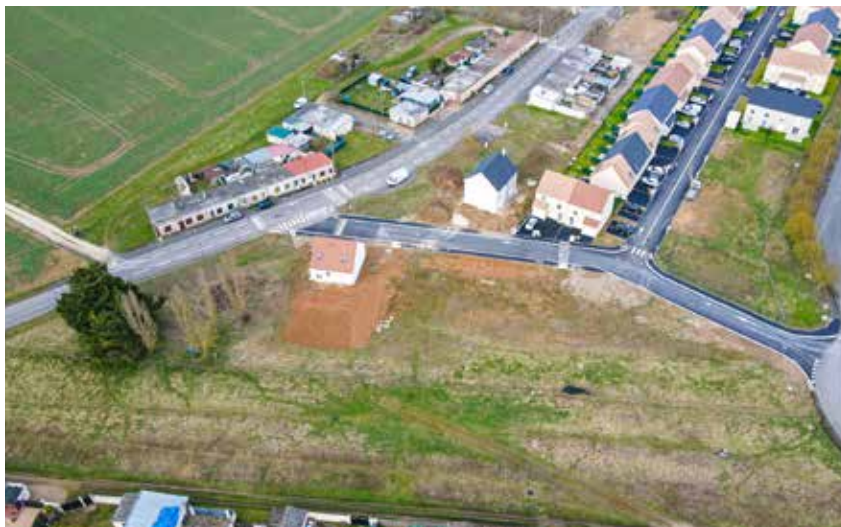
De nouveaux lotissements voient le jour dont un au Passage des Buttes, situé à proximité de la gendarmerie des Murgers.

Quatre programmes d'aménagements urbains proposés par la Maison de l'Habitat et du Commerce sont en cours de commercialisation à Dreux (Passage des Buttes, quartier des Murgers, Le Clos du Parc à l'entrée du parc Louis-Philippe ; L'Orée des champs aux Hameaux de Paul-