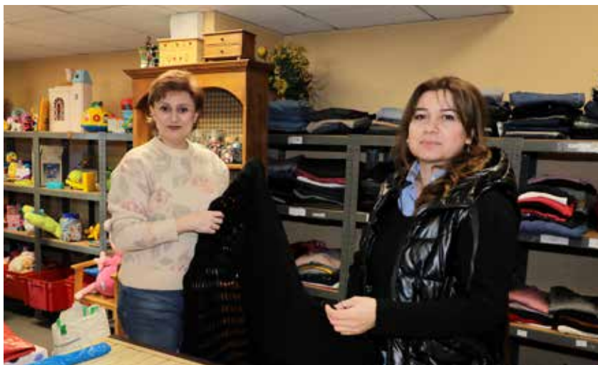
Le coin vestiaire est très fréquenté par les bénéficiaires.

D'autre part, des séjours de vacances sont proposés en période estivale à tous les bénéficiaires du département. Afin de célébrer les 80 ans du Secours populaire, l'antenne de Dreux a prévu un grand repas avec ses bénéficiaires le 8 novembre prochain au Parc des expositions de la Ville de Dreux. En tant qu'association d'utilité publique, la structure peut compter sur le soutien de la municipalité drouaise qui lui a cédé, en juin 2023, une parcelle de terrain de 270 m 2 pour un euro symbolique. Depuis, les bénévoles de l'association