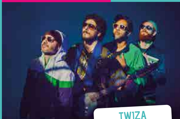
TWIZA (BERBÈRES CHAÂBI)