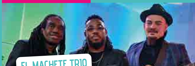
EL MACHETE TRIO (CUBAIN)