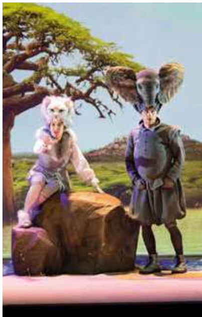
© Histoires comme ça - Droits réservés - Corinne Marianne Pontoir.

l'occasion d'assister à un spectacle musical librement inspiré de Rudyard Kipling, Histoires comme ça . Autre bijou dédié aux plus jeunes, Naïkô , un spectacle cinématographique qui oscille entre illusions et réalités.