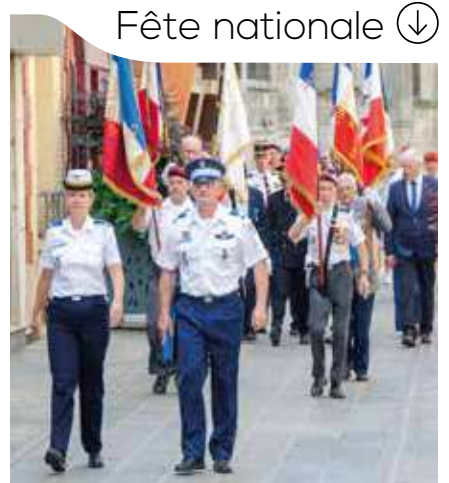
Fête nationale ⬇