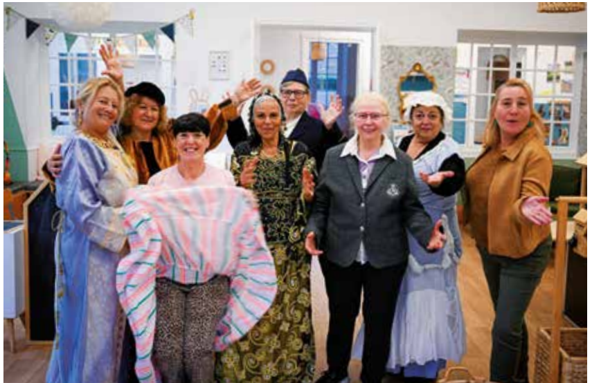
Composée de femmes passionnées, la troupe Les Extra-ordinaires de la MDF partagera sa création originale lors de deux représentations publiques.

« On a cherché à reprendre le parcours de la violence de façon chronologique, détaille l'élue. La programmation s'articule en quatre étapes : chaque semaine, une thématique spécifique est abordée : identifier les violences, comprendre leurs conséquences sur les victimes, envisager des moyens pour s'en sortir et enfin, amorcer la reconstruction. » Cette progression permet de proposer une réflexion complète et accessible, qui s'adresse autant aux victimes qu'à leurs proches, aux témoins ou aux