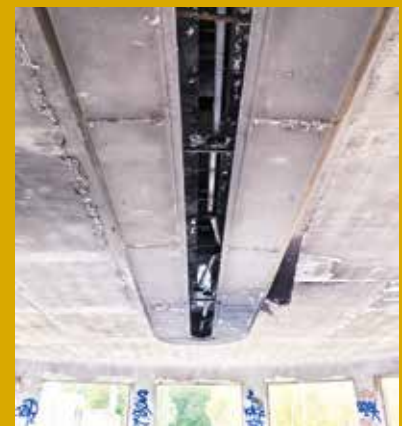
Élément d'époque, la corniche lumineuse du pavillon Pasteur sera réhabilitée et mise en valeur.

L'ancien sanatorium entame sa nouvelle vie sous les meilleurs auspices : les 225 logements ont tous déjà trouvé preneurs.