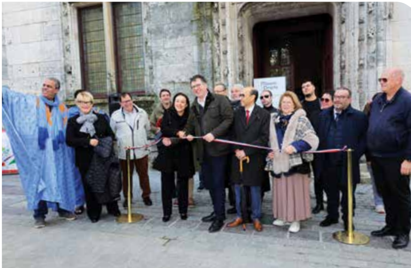
Foire Saint-Denis Ⓣ

Entre moments familiaux, culturels, sportifs, solidaires et intergénérationnels, Dreux a bouillonné d'énergie ! Les grands rendez-vous d'octobre ont offert leur lot de saveurs, de couleurs, de rencontres et de sensations fortes. Un mois vivant et généreux, qui donne le ton avant les festivités de fin d'année !