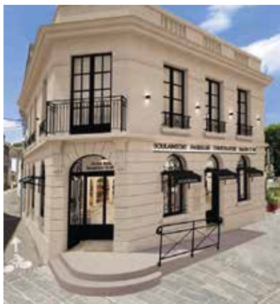
Perspective 3D

“ Le projet a beaucoup évolué et a demandé du temps, mais ça y est : le permis de construire est délivré. Nous sommes prêts à débiter les travaux et à ouvrir dans quelques mois ”