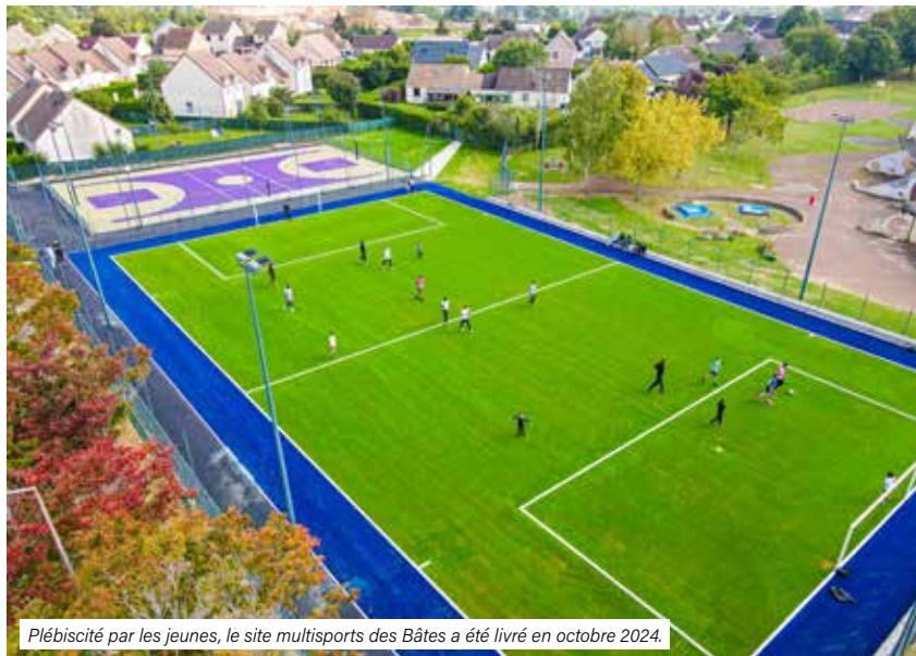
Plébiscité par les jeunes, le site multisports des Bâtes a été livré en octobre 2024.

“ C'est très fréquenté, bien respecté et bien géré. C'est une grande satisfaction de voir que ça fonctionne si bien et que ça plaît autant. ”