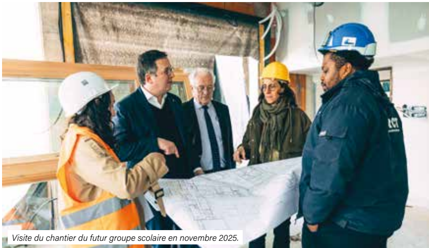
Visite du chantier du futur groupe scolaire en novembre 2025.

dégradations devront être intégrées au planning général, dont la livraison prévisionnelle est envisagée d'ici deux mois. Une échéance que le maire de Dreux aborde avec prudence : « Je ne souhaite pas précipiter les choses. Il faut que ça se passe dans de bonnes conditions, car quand on livre un tel équipement, il y a toujours des ajustements. Si les équipes pédagogiques estiment qu'elles sont prêtes, nous emménagerons. Avant toute date de rentrée, il faudra s'assurer qu'il n'y a pas le moindre risque pour les enfants avec la poursuite du chantier. »