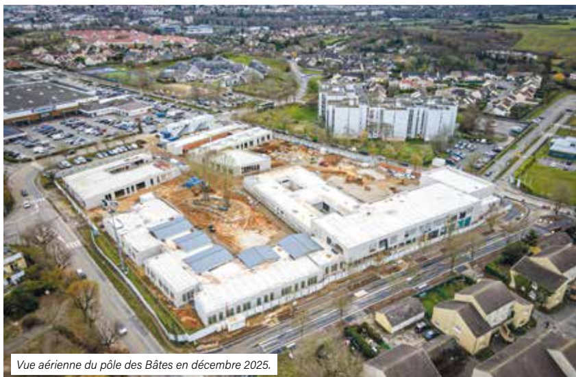
Vue aérienne du pôle des Bâtes en décembre 2025.

Alors que la fin du gros œuvre touche à sa fin, les équipes du