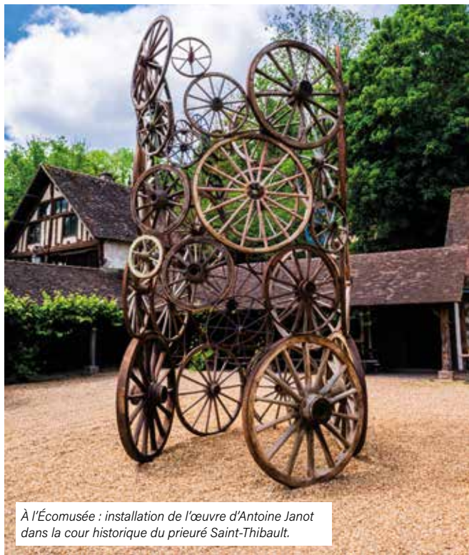
À l’Écomusée : installation de l’œuvre d’Antoine Janot dans la cour historique du prieuré Saint-Thibault.