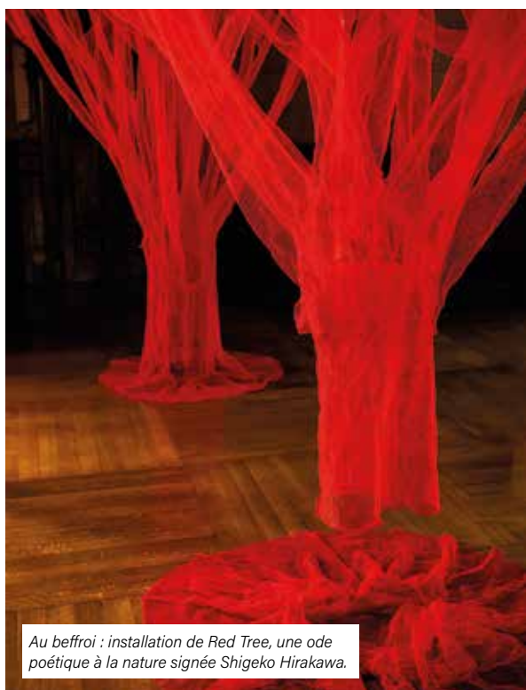
Au beffroi : installation de Red Tree, une ode poétique à la nature signée Shigeo Hirakawa.

les structures programmatrices : les galeries de l’Odyssée, L’Horlogie, BazArts, l’association Terre d’artistes qui occupe la Maison des Arts de l’Hôtel Montulé, ou encore l’Écomusée des Vignerons et Artisans drouais. Sans oublier, les commissaires d’exposition qui ont assuré la sélection des artistes et artisans pour le beffroi, l’église, l’Écomusée, l’Odyssée et l’ar[T]senal : Élise Giraud pour les métiers d’art, Lucile Hitier pour les arts visuels, et Clémence Poupin pour le patrimoine. Une première édition riche en talents et en énergies, qui s’annonce ambitieuse et prometteuse pour le rayonnement artistique et patrimonial de Dreux.