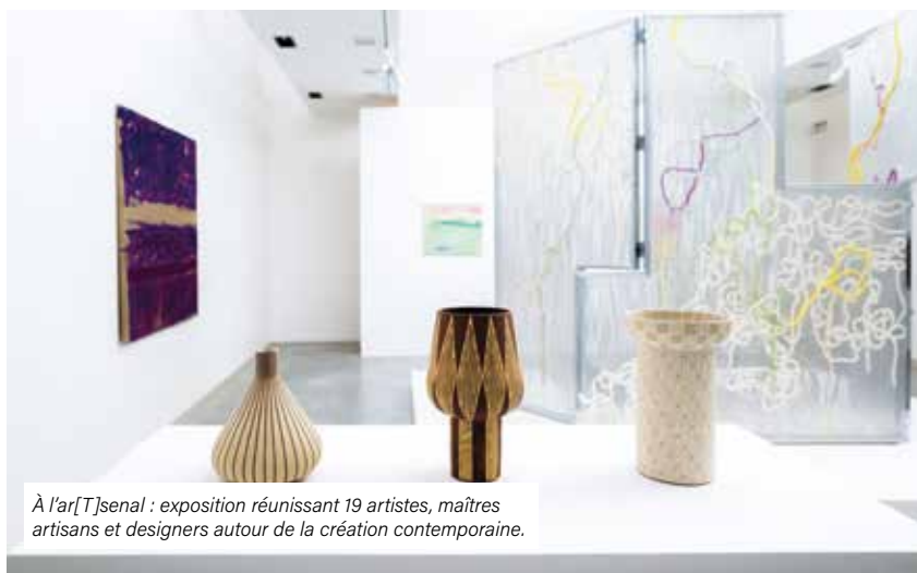
À l'ar[T]senal : exposition réunissant 19 artistes, maîtres artisans et designers autour de la création contemporaine.

Si certains événements s'imposent comme une évidence, d'autres naissent d'une nécessité. PANORAMA appartient résolument à cette seconde catégorie. Elle répond à un besoin profond de donner à voir et à célébrer un territoire qui crée, fabrique et imagine. La Biennale est ainsi née d'une double impulsion : • le rapprochement entre Art et