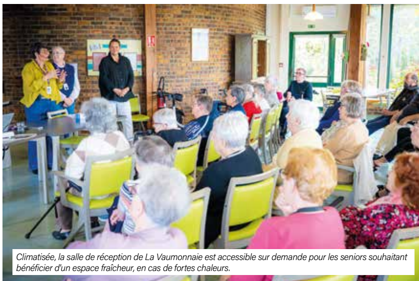
Climatisée, la salle de réception de La Vaumonnaie est accessible sur demande pour les seniors souhaitant bénéficier d'un espace fraîcheur, en cas de fortes chaleurs.

le maintien à domicile grâce notamment à la découverte de "Maison Maurice", un outil régional destiné à mieux prévenir le risque de chute.