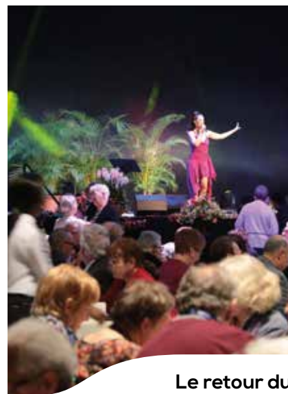
Le retour du Banquet des seniors