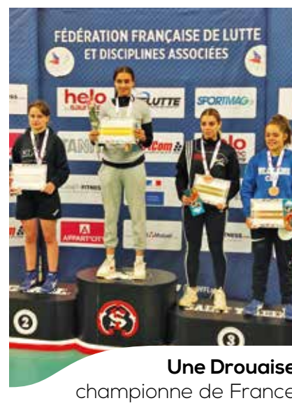
Une Drouaise championne de France junior en lutte