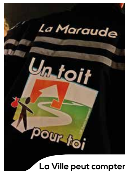
La Ville peut compter sur ses partenaires