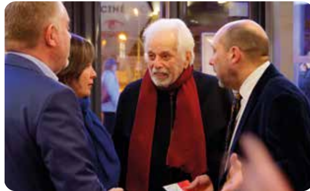
Invité exceptionnel de cette édition, le réalisateur Alejandro Jodorowsky venu présenter au public son film La Danza de la Realidad .