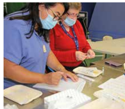
Le centre de vaccination a fermé ses portes