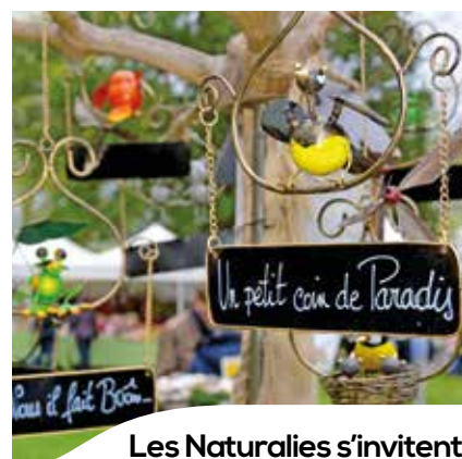
Les Naturalies s'invitent pour le week-end de Pâques