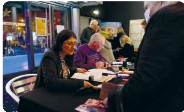
Les bénévoles étaient à pied d'œuvre au CinéCentre pour accueillir les visiteurs venus en nombre pour assister aux projections.