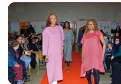
Défilé de mode femme du monde, expo, concert à la maison Proximum Sainte-Ève