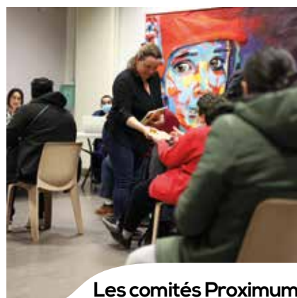
Les comités Proximum en mode projet