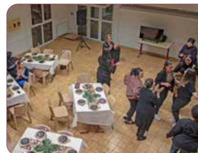
Soirée 100% femmes à la maison de quartier des Rochelles