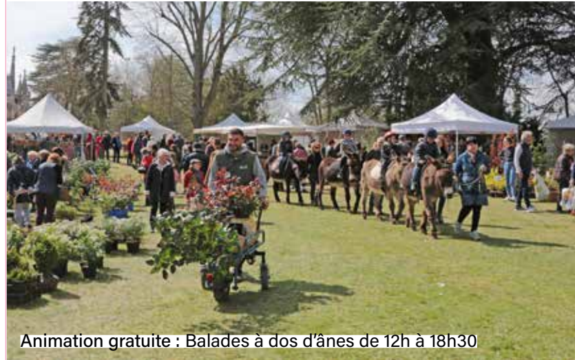
Animation gratuite : Balades à dos d'ânes de 12h à 18h30

Un service de brouettage jusqu'à votre véhicule vous sera proposé par le service des espaces verts de la Ville ainsi qu'une mise à disposition de mulch , une variété de terreau écologique utilisé en permaculture. Enfin, pour vous permettre de faire vos achats en toute tranquillité, une garderie pour plantes sera également proposée.