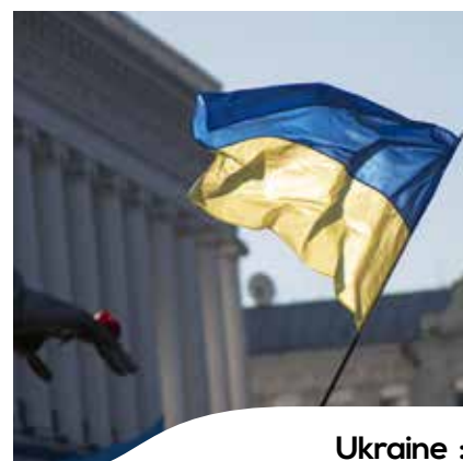
Ukraine : la solidarité s'organise