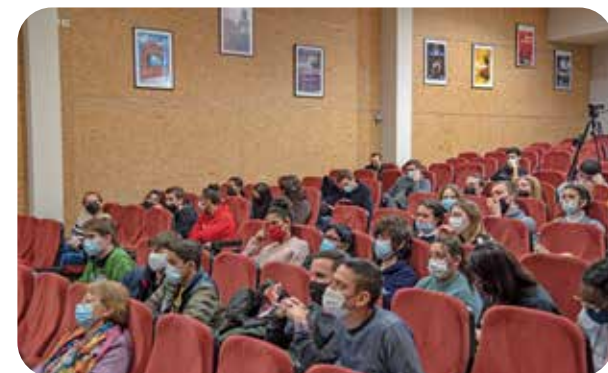
Les élèves du lycée Rotrou ont pu assister à des masterclass animées par des cinéastes chiliens. L'occasion pour eux d'apprendre plus sur la pratique cinématographique.