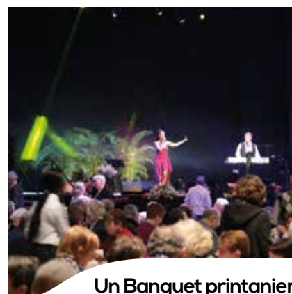
Un Banquet printanier pour nos aînés