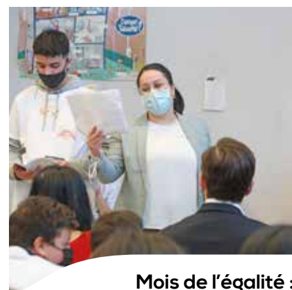
Mois de l'égalité : retour sur les temps forts