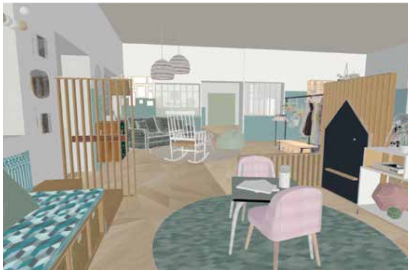
Projection pièce rdv avec division des espaces