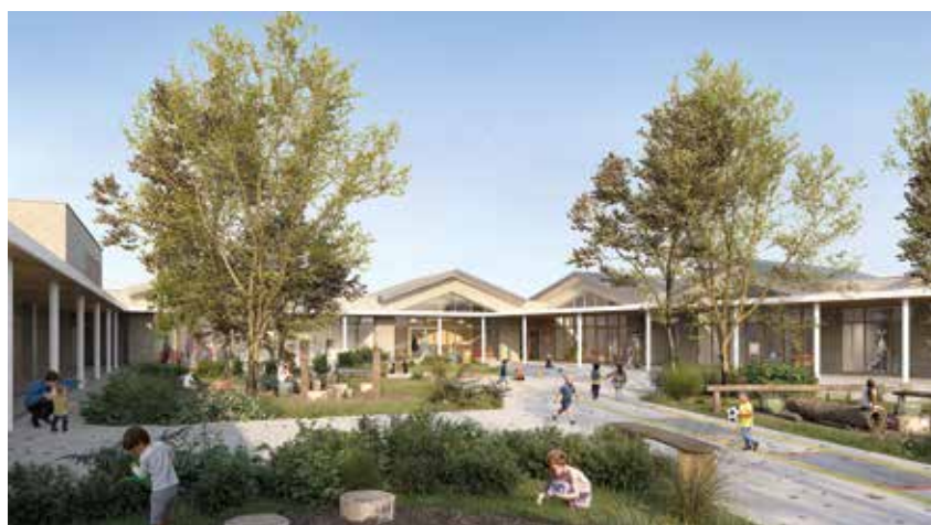
Perspective d'une des deux cours de récréation végétalisées

capacité d'accueil de 443 élèves. Un groupe scolaire d'autant plus important qu'il sera complété par un accueil périscolaire pouvant recevoir jusqu'à 88 enfants, un multi-accueil de 650 m 2 , soit 56 berceaux, un centre social, et une bibliothèque moderne.