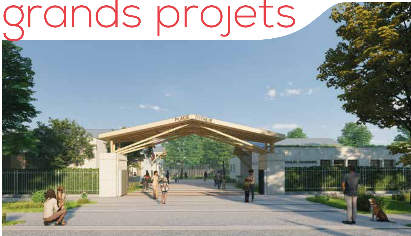
Perspective de la Place d'Italie, porte d'entrée du pôle éducatif et culturel des Bâtes