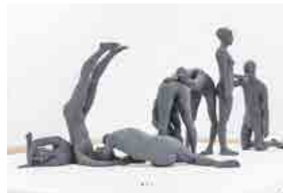
Daniel Firman, Gestes Dansés, 2013

Constituée de trois accrochages successifs – de février à septembre – l'exposition rassemble plusieurs pièces de l'artiste réalisées entre 1991 et 2025 et témoignent de la multiplicité des formes de son travail qui passe de la sculpture à