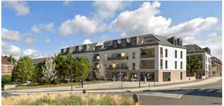
Une placette avec un espace végétalisé sera aménagée à l'angle du rond-point Saint-Denis © Document non contractuel - Droits réservés.

Plus d'informations. Espace de vente Bouygues Immobilier, situé devant la gare SNCF.