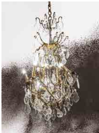
Daniel Firman, Up/ down #3, 2007 - Courtesy de l'artiste - Crédit photo : Blaise Adillon

Après avoir embarqué un public toujours plus nombreux à travers des expositions collectives pendant 8 ans, le Centre d'art contemporain de Dreux ouvre l'année avec une plongée dans l'univers d'un artiste unique : le drouais Daniel Firman. Une magnifique exposition en 3 volets à découvrir.