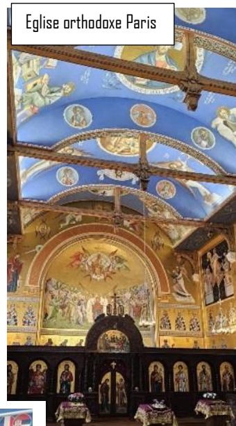
Eglise orthodoxe Paris