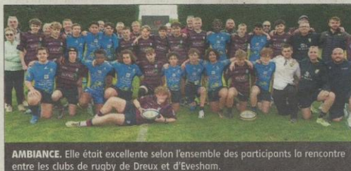
AMBIANCE. Elle était excellente selon l'ensemble des participants la rencontre entre les clubs de rugby de Dreux et d'Evesham.

Treize jeunes joueurs du Evesham Rugby-club étaient accom-