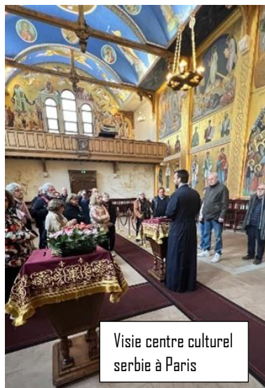
Visite centre culturel serbie à Paris