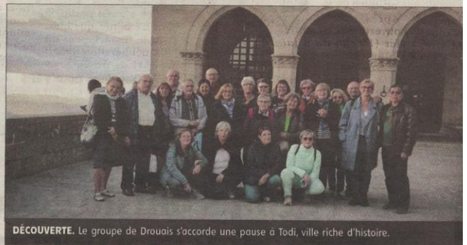
DÉCOUVERTE. Le groupe de Drouais s'accorde une pause à Todi, ville riche d'histoire.

■ Quels furent les points forts de votre séjour ? La signature du renouvellement de protocole du jumelage Dreux-Todi et Melsungen-Todi. Le repas officiel fut